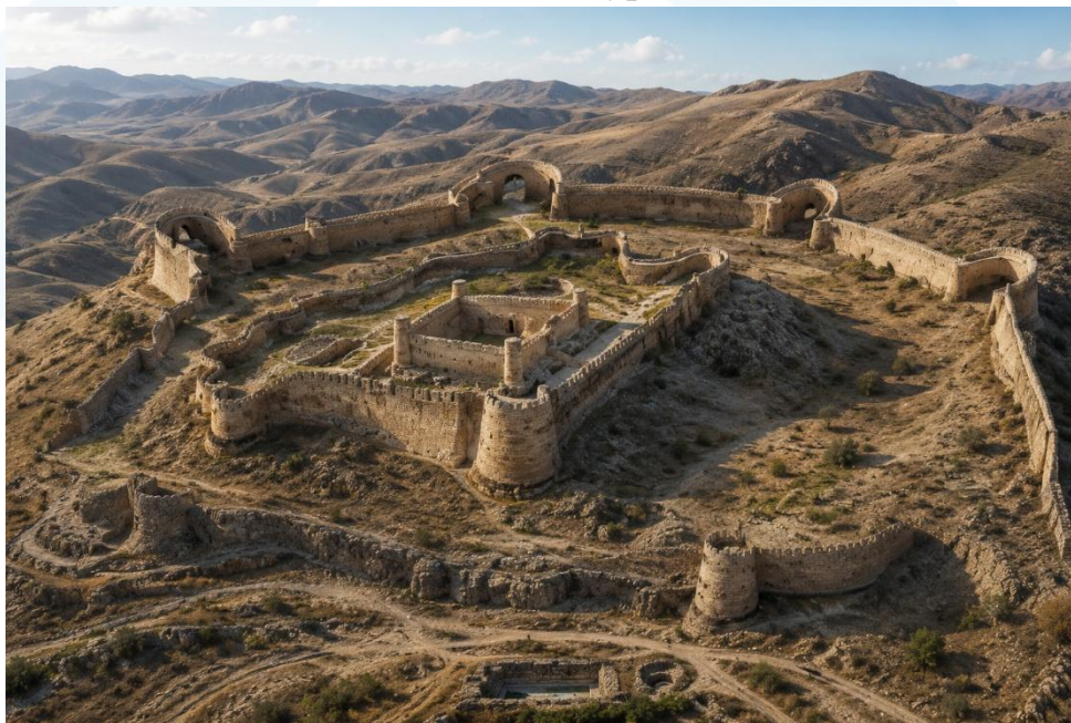
Рис 3. Вариант графической реконструкции крепости Нур. Выполнена автором статьи.

Несмотря на значительное количество публикаций, до настоящего времени исследователи еще находят материалы и добавляют в летопись исследования Нураты, Изучение эволюции градостроительной структуры города позволяет по-новому рассмотреть формирование оборонительной системы, особенности фортификационного сооружения, взаимосвязь природного ландшафта и архитектурной композиции, а также выполнить научно обоснованную реконструкцию первоначального облика крепости Нур. Именно эти аспекты определяют актуальность и продолжение дальнейших исследований памятников Нураты.