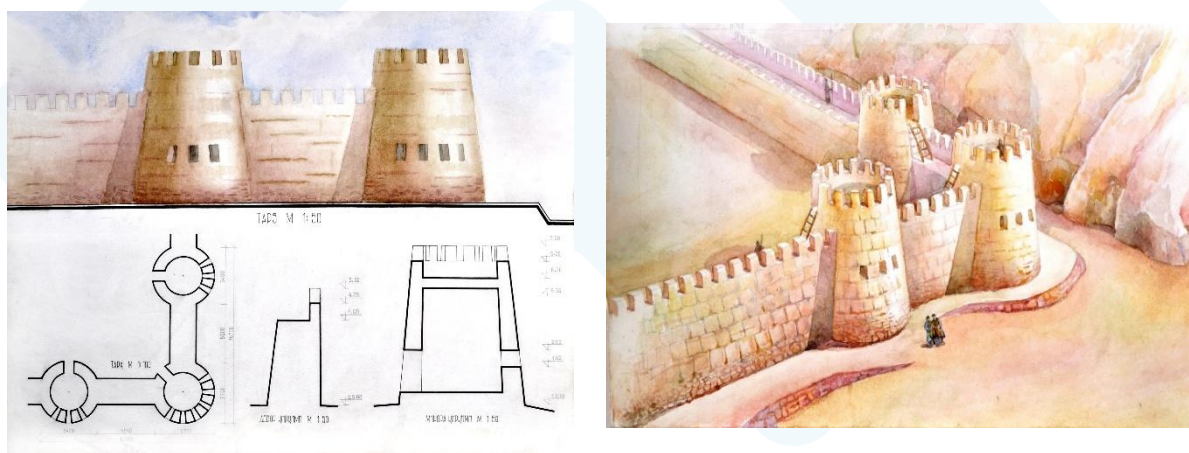
Рис. 1. Реконструкция оборонительной стены крепости Нур. Автор реконструкции Д.А. Назилов.

Историография архитектурного наследия Нураты складывалась на протяжении длительного времени и включает несколько основных этапов. Первые сведения о городе содержатся в письменных источниках средневекового Востока. Наиболее раннее и систематизированное описание Нураты представлено в труде Абу Бакр Мухаммад ибн Джафар ан-Наршахи, который характеризовал город как одно из значимых поселений Бухарского государства, обладавшее развитой системой оборонительных сооружений и являвшееся важным религиозным центром региона. Ценные сведения об историческом развитии Нураты, ее культурной среде и духовной жизни содержатся также в трудах Хафиз Таныш Бухари, Алишер Навои и Абдулкарим ас-Самъани.